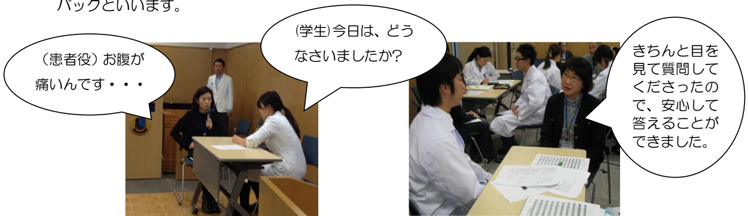
↑ 模擬患者用の台本をもとに「患者さん」を演じます。 この場合はお腹が痛い設定です。