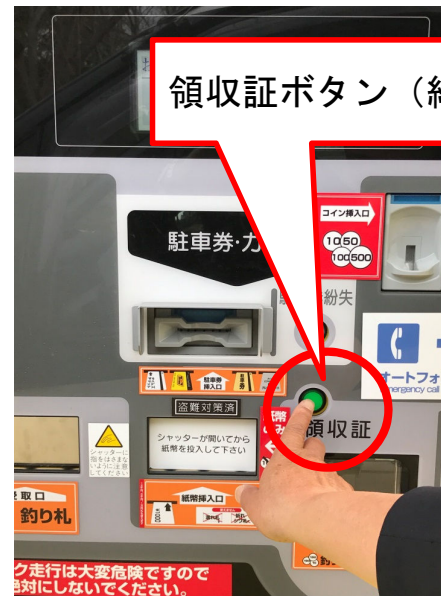
③ ゲートバーが開いたら、領収証ボタンを押す