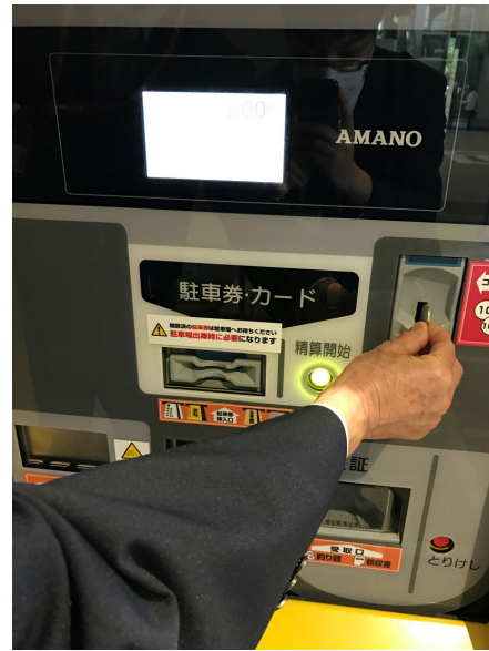
② 表示された料金を支払う