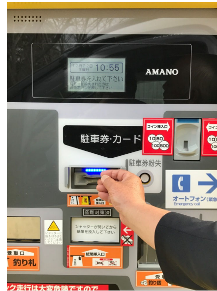
① 駐車券を挿入する