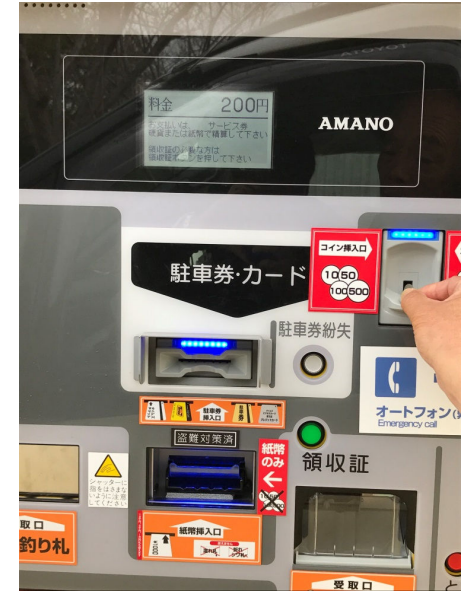
② 表示された料金を支払う