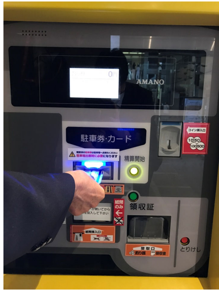
① 駐車券を挿入する