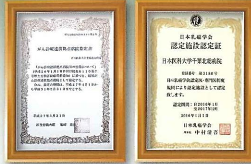
当院は日本乳癌学会認定施設にも認定されました。