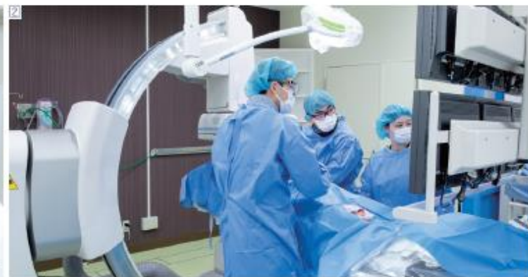
② カテーテル治療の様子