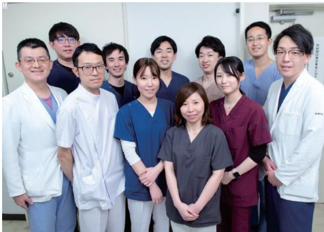
① 循環器内科の医師とスタッフ。チーム医療で診療にあたる