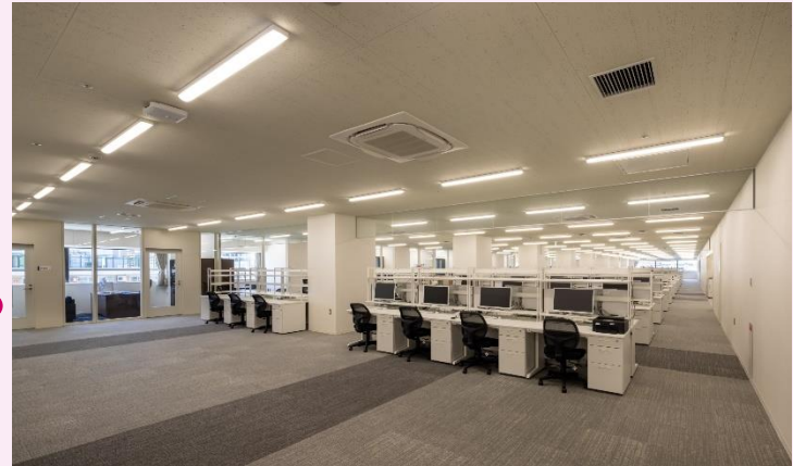
5階 多目的スペース