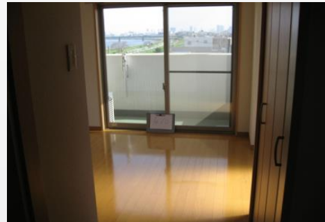
内装(ワンルーム)トイレ・バス別