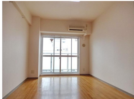
内装(ワンルーム)トイレ・バス別