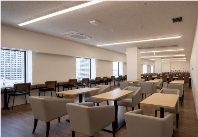
9階 スタッフラウンジ