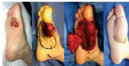
末梢黒子型悪性黒色腫 の切除と荷重部の再建